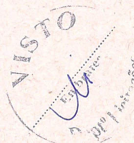
JEFERSON THOMAS TICKET SOLUÇÕES HDFGT S/A - TICKET LOG.